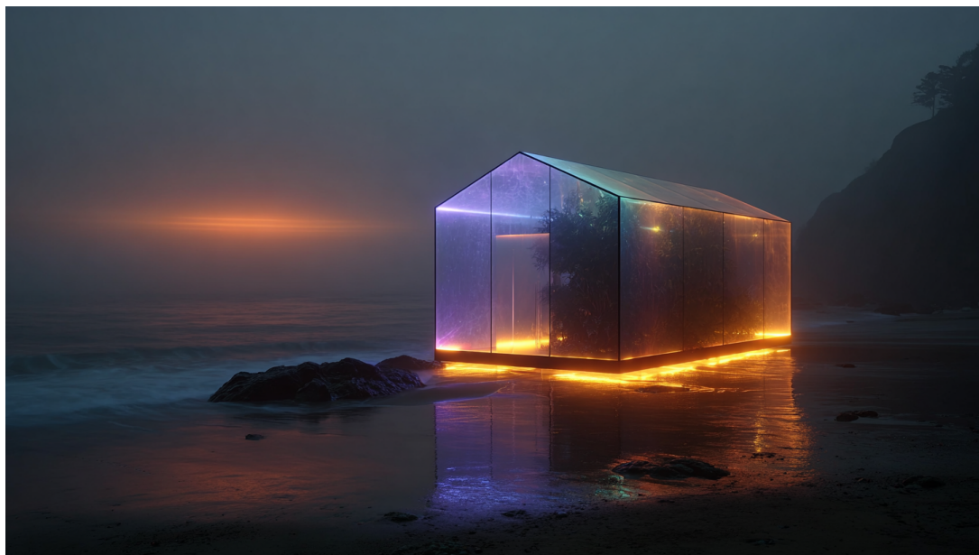
Figura 6: [Ψ·OBS] serra maior

Contaminazione Vergogna (30%): Manifestazione riflessi corporei deformati, amplificazione senso colpa, inibizione simultanea a disinibizione (effetto paradossale). Superfici specchianti generate dinamicamente. Effetto combinato Desiderio + Vergogna: paralisi decisionale, oscillazione tra azione compulsiva e ritiro, conflitto interno amplificato.