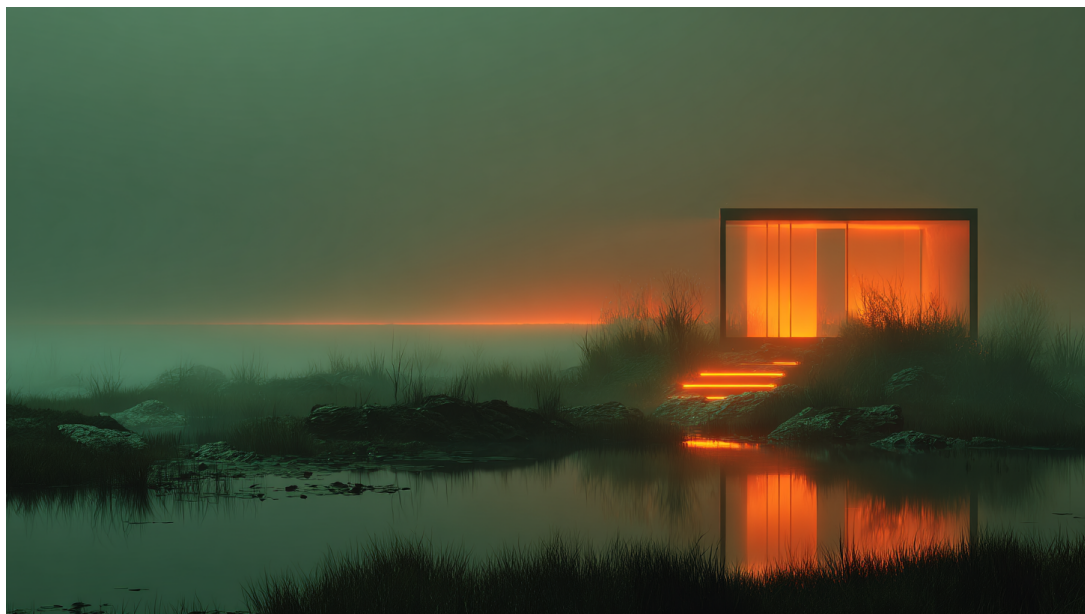
Figura 3: [Ψ·OBS] serra:entrata-percepita.cc2

[Ψ·SIN] Entrano contemporaneamente. La Serra del Contatto.