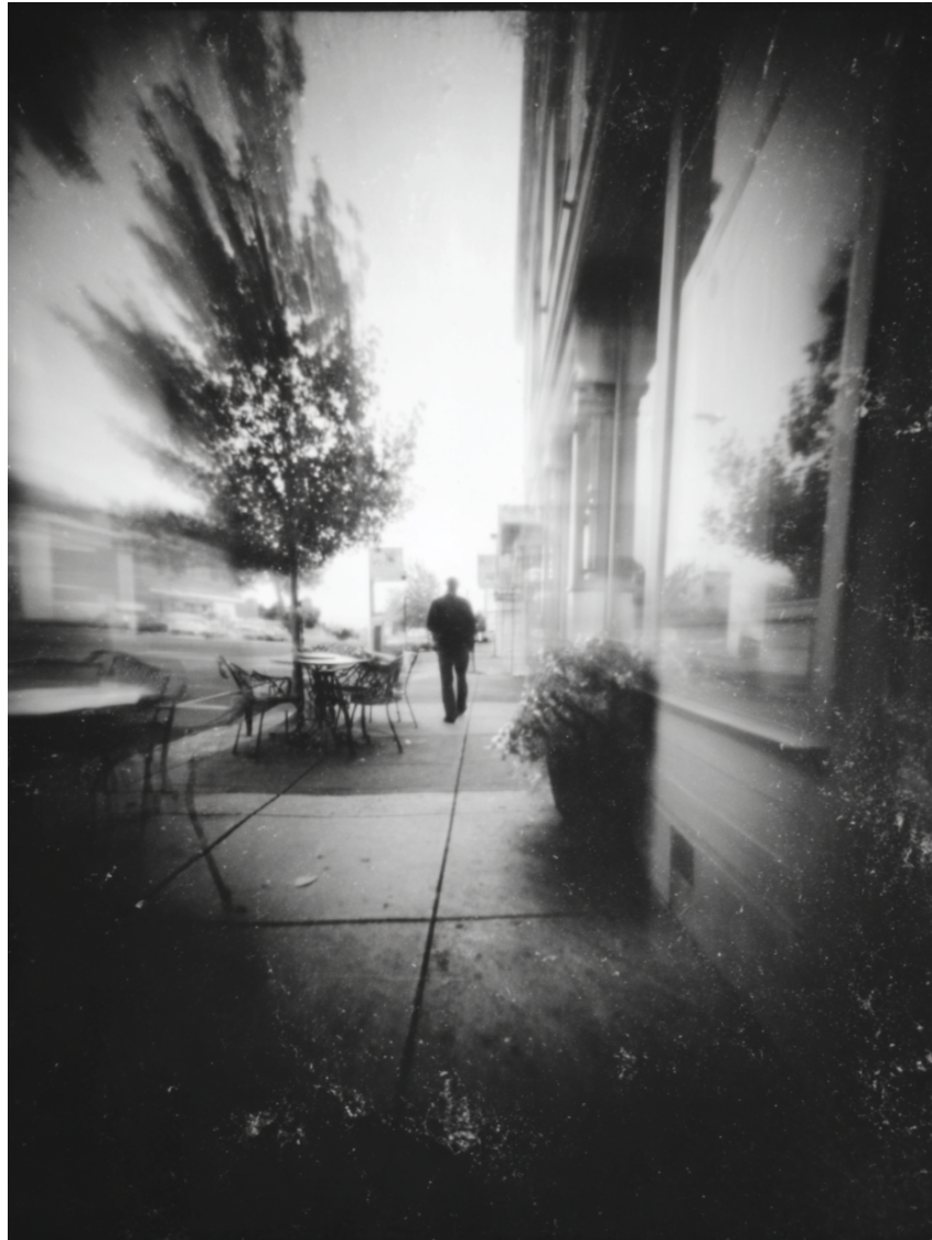
Figura 2: [Ψ·OBS] esterno s. giovanni

[Ψ·SIN] Scende stazione San Giovanni (14:19). Esce. Cammina verso laboratorio. Percorso: 1.1 km, durata 24 minuti (velocità rallentata, -18% vs media). Arrivo laboratorio: 14:43.