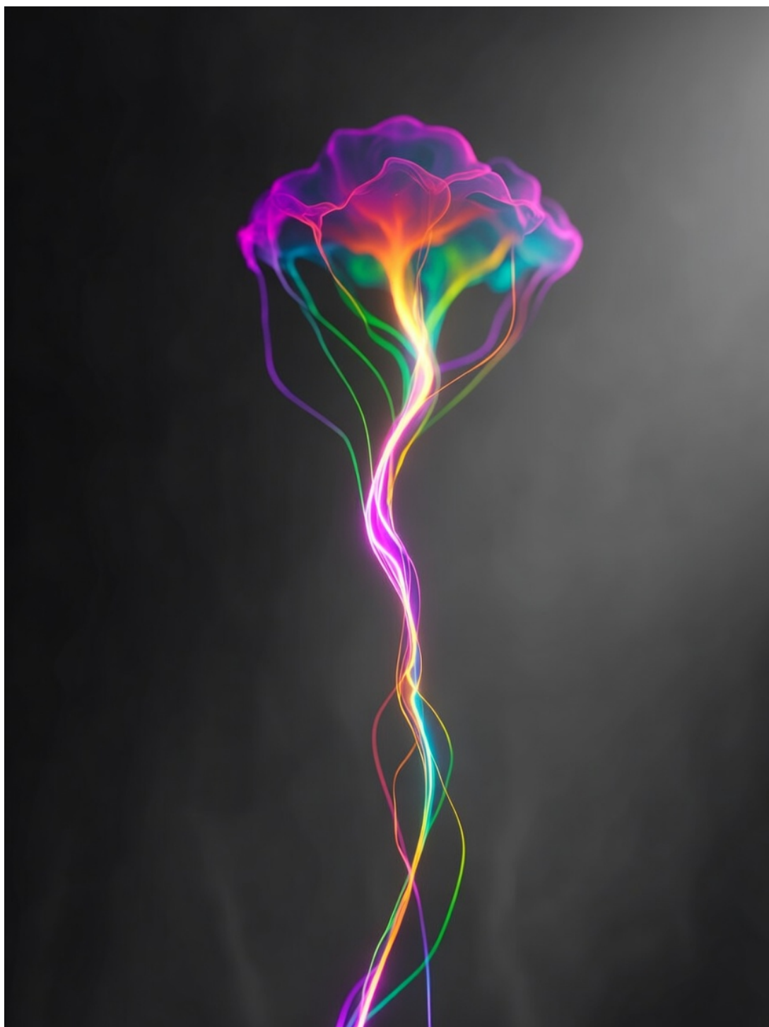
Figura 7: L20-spettro-odori