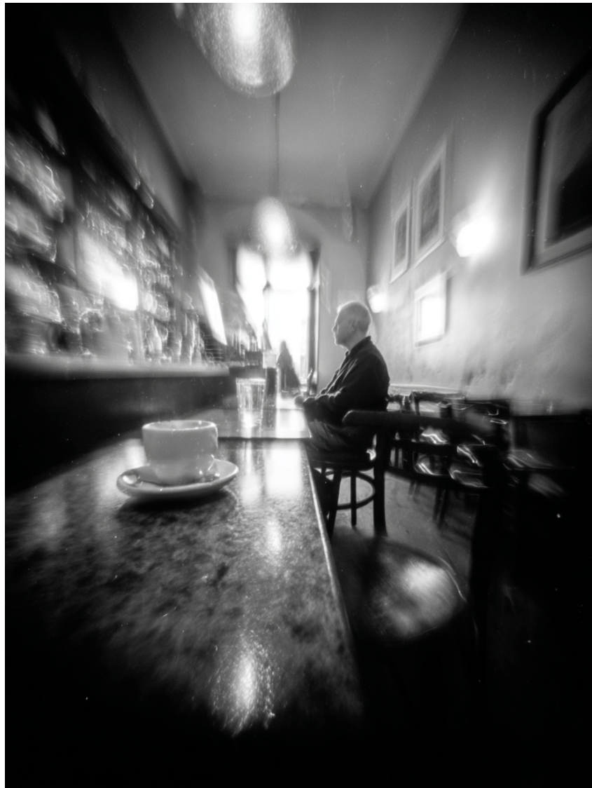
Figura 1: [Ψ·OBS] interno bar

[Ψ·OBS] Ambiente: Bar "Necci", via Fanfulla da Lodi, Roma (Pigneto). Temperatura esterna: 11.2°C. Illuminazione: naturale alba + luci bar.